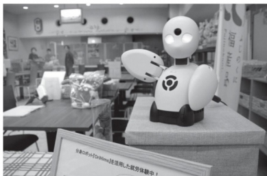
▲喫茶びあ〜(県庁東館2階)でOriHime(オリヒメ)がふじのくに福産品をご紹介します

働きたくても、身体・精神障害、病気、介護、育児、高齢などの理由から就労が難しく、地域社会とつながるにはハードルが高い方がいらっしゃると思います。家にいながら働くことができれば…という思いを実現するために、行政・事業者との連携による挑戦が始まりました。昨年12月から喫茶びあ〜に導入されたのは遠隔操作ロボット「OriHime(オリヒメ)」。3月までふじのくに福産品の商品案内を行ってまいります。