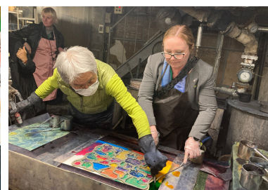
浜松注染そめ体験