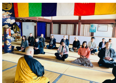
可睡齋での座禅体験