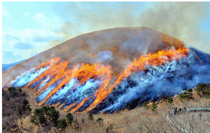
昨年の山焼きの様子